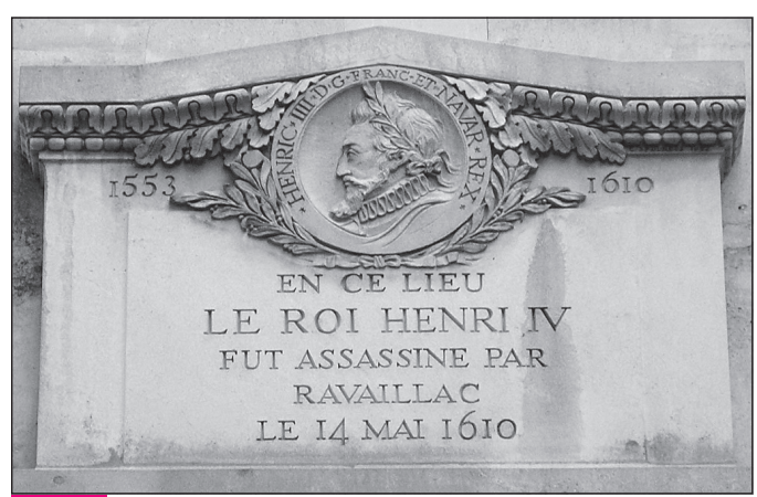
Doc. 5 Plaque de marbre ; 11, rue de la Ferronnerie à Paris.

8. À qui ce texte accorde-t-il des droits ?