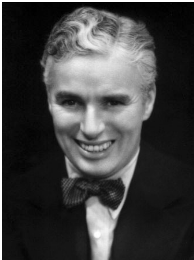
Charlie Chaplin en 1936

Il est repéré aux Etats-Unis par la Keystone , firme spécialisée dans le burlesque (slapstick) . Il crée le personnage de Charlot en 1914, joue et tourne d'innombrables courts et longs-métrages. Le succès est fulgurant. Il devient l'artiste le mieux payé au monde dès 1916 et signe plusieurs chefs d'œuvre : Le Kid (1921), La Ruée vers l'or (1925), Les Lumières de la ville (1931). Pour la promotion de ce dernier film, Charles Chaplin fait un tour du monde. Il prend conscience des ravages de la crise économique. Elle devient sa source d'inspiration principale pour Les Temps Modernes .