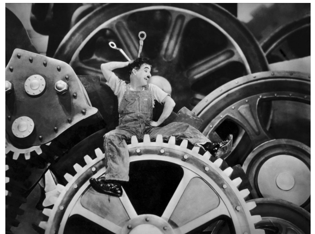
Le ballet de Charlot, rendu fou par les machines

A sa sortie, il est pris pour un meneur de manifestation et est arrêté. Libre, il fait la rencontre de la Gamine (Paulette Goddard), une jeune orpheline, qui vole de la nourriture pour ne pas mourir de faim. Les deux vagabonds partent en quête d'un travail pour sortir de la misère.