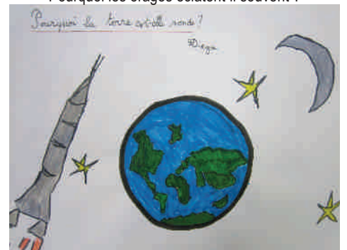
Pourquoi la terre est-elle ronde ?