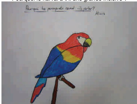
Pourquoi les perroquets savent-ils parler ?