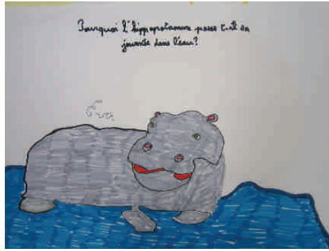
Pourquoi l'hippopotame passe-t-il sa journée dans l'eau ?