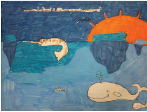
Pourquoi le narval a-t-il une grande incisive ?