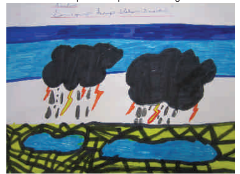
Pourquoi les orages éclatent-ils souvent ?