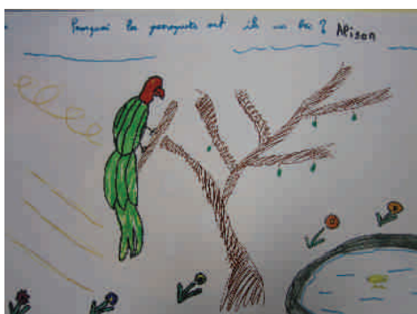
Pourquoi les perroquets ont-ils un bec ?