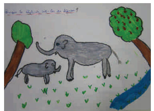
Pourquoi les éléphants ont-ils des défenses ?