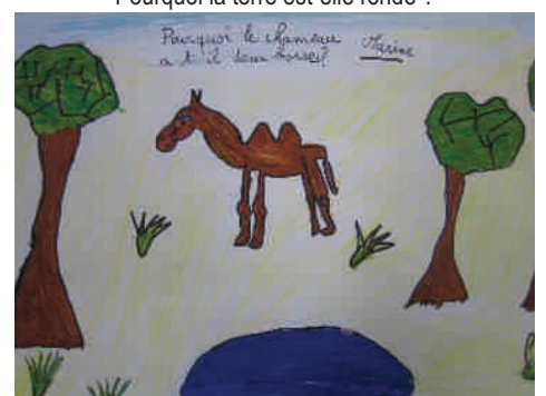
Pourquoi le chameau a-t-il deux bosses ?