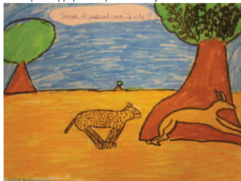
Pourquoi le guépard court-il si vite ?