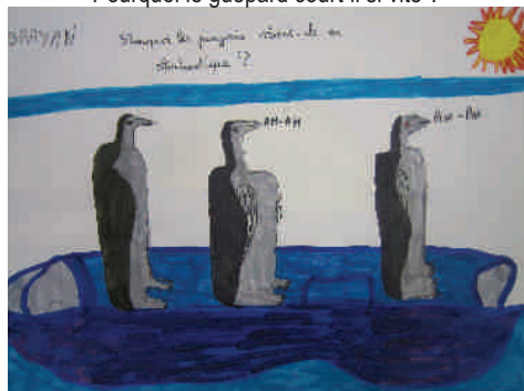
Pourquoi les pingouins vivent-ils en Antarctique ?