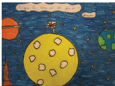
Pourquoi la lune est-elle grande ?