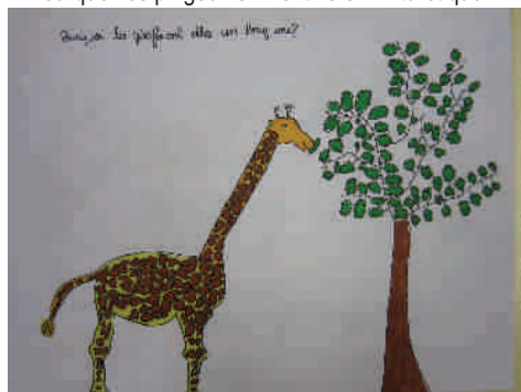
Pourquoi les girafes ont-elles un long cou ?