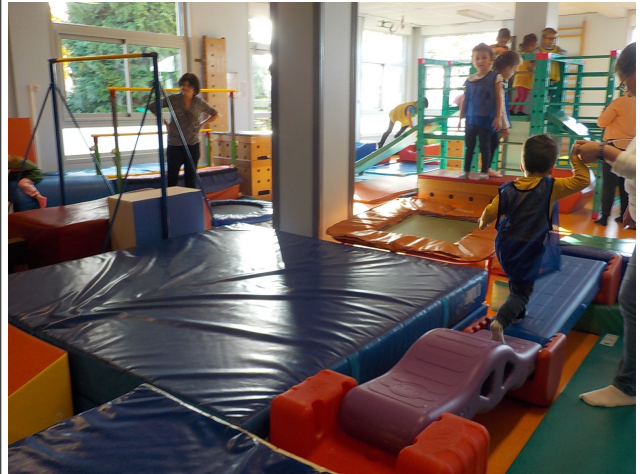
Après on devait aller sur les ponts.