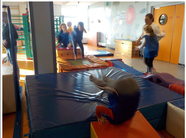
On sautait sur le trampoline.