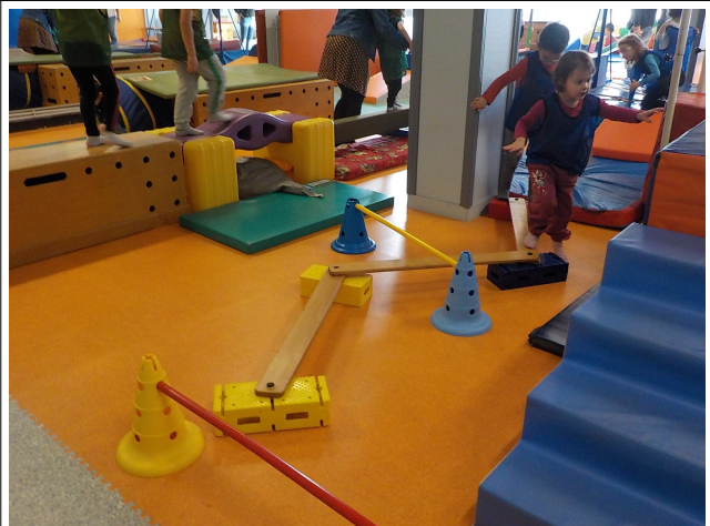
A la fin, on marchait sur les poutres et les briques.