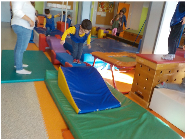
Après on devait faire une roulade sur le tapis penché.