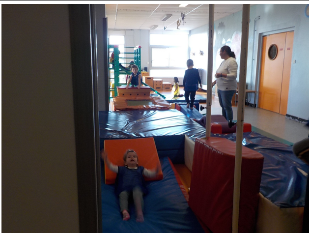
on a fait une autre pirouette.