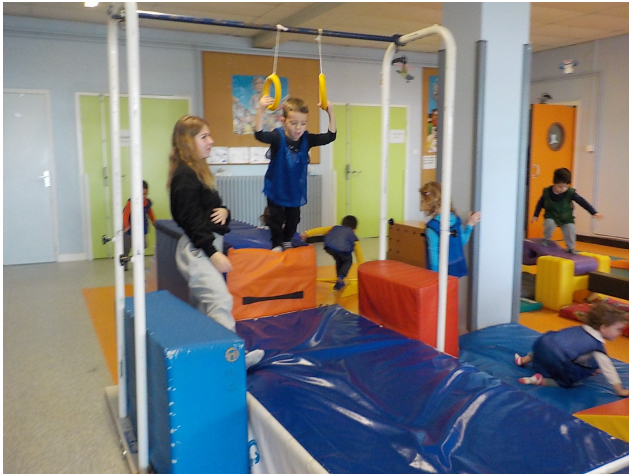
Au début, il fallait monter sur un gros coussin et se balancer à des anneaux pour sauter sur le tapis.