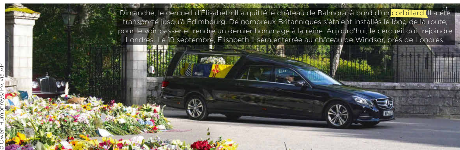
Dimanche, le cercueil d'Élisabeth II a quitté le château de Balmoral à bord d'un corbillard . Il a été transporté jusqu'à Édimbourg. De nombreux Britanniques s'étaient installés le long de la route, pour le voir passer et rendre un dernier hommage à la reine. Aujourd'hui, le cercueil doit rejoindre Londres. Le 19 septembre, Élisabeth II sera enterrée au château de Windsor, près de Londres.

Comment s'appelait le mari d'Élisabeth II, décédé en avril 2021 ?