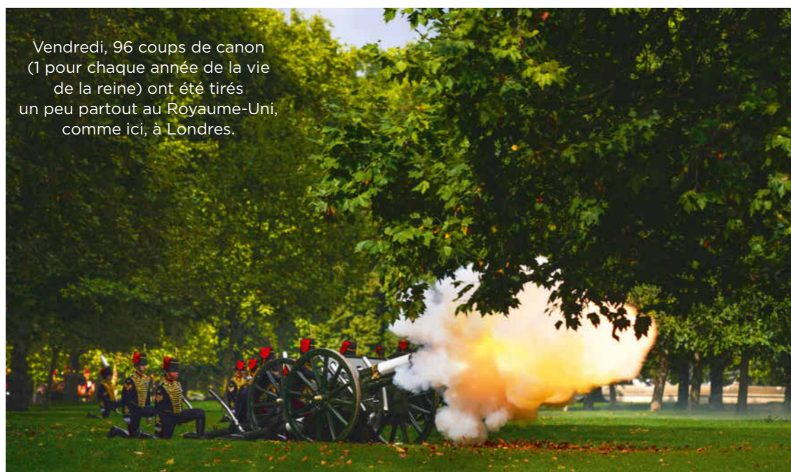
Vendredi, 96 coups de canon (1 pour chaque année de la vie de la reine) ont été tirés un peu partout au Royaume-Uni, comme ici, à Londres.