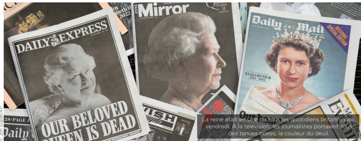
La reine était en Une de tous les quotidiens britanniques, vendredi. À la télévision, les journalistes portaient tous des tenues noires, la couleur du deuil.