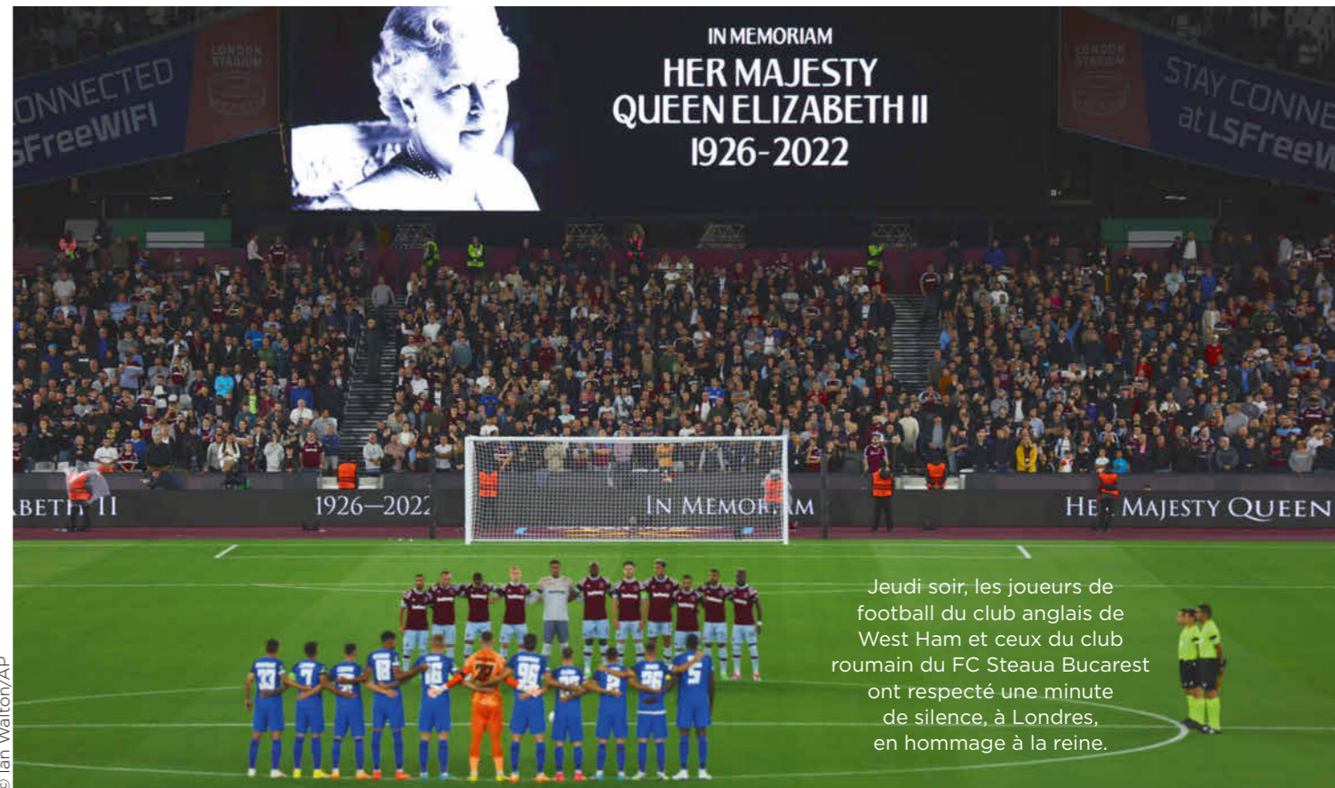
Jeudi soir, les joueurs de football du club anglais de West Ham et ceux du club roumain du FC Steaua Bucarest ont respecté une minute de silence, à Londres, en hommage à la reine.