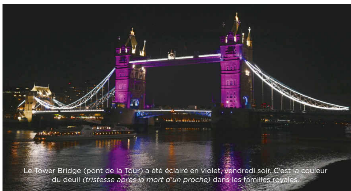
Le Tower Bridge (pont de la Tour) a été éclairé en violet, vendredi soir. C'est la couleur du deuil ( tristesse après la mort d'un proche ) dans les familles royales.