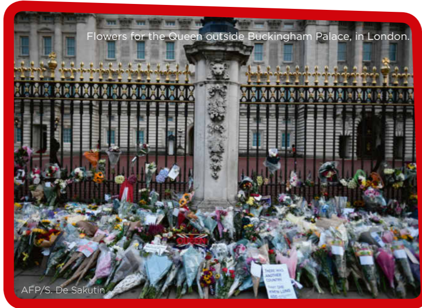
Flowers for the Queen outside Buckingham Palace, in London.

La reine Élisabeth II (2) a eu le règne le plus long pour un monarque en Grande-Bretagne.