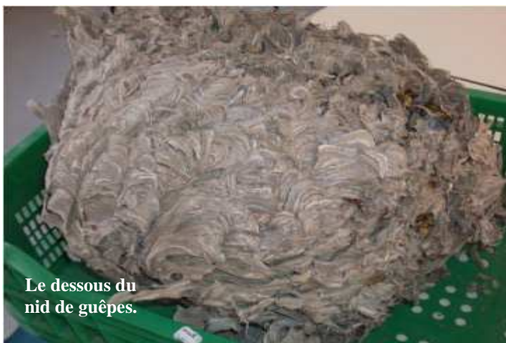
Le dessous du nid de guêpes.

L'an passé, les pompiers sont aussi venus enlever un nid de guêpes sous le préau de l'école. Ils sont intervenus quand nous n'étions pas là. Ils ont dû casser le plafond pour retirer le nid. Ce dernier était tout détruit, on ne l'a pas vu.