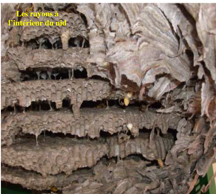
Les rayons à l'intérieur du nid

Le nid terminé mesure jusqu'à 50 cm de diamètre. Il comporte en dessous un petit trou qui sert d'entrée, facile à défendre contre d'éventuels ennemis.