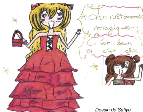
Dessin de Safiye