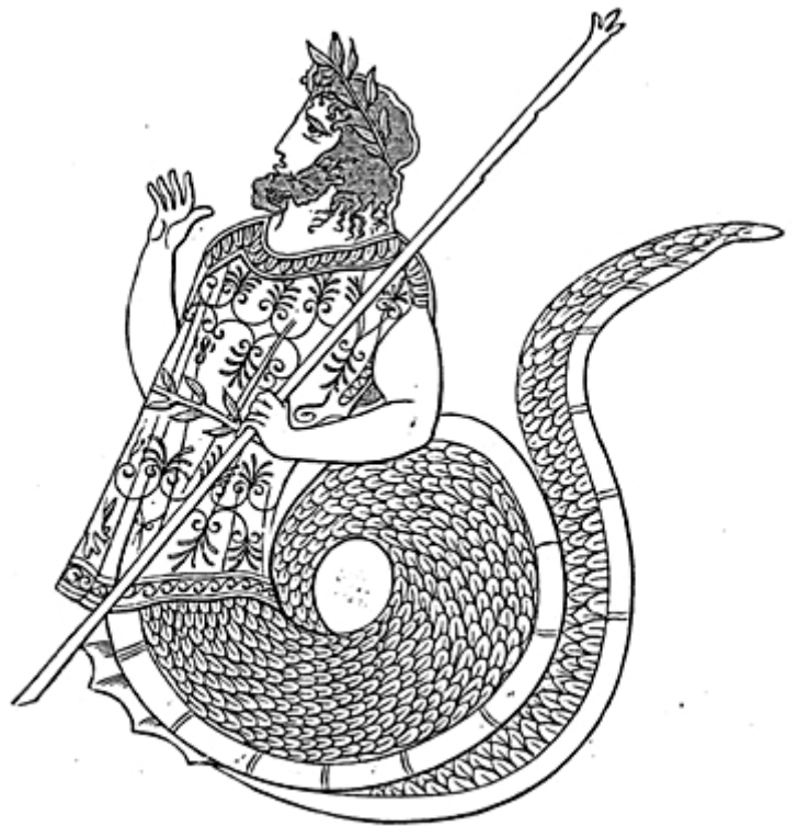
Cécrops, le roi-serpent, fondateur d'Athènes

Poséidon , plantant aussitôt son trident, fit jaillir du sol une abondante source d'eau salée. Il offrait à l'Attique un grand lac où les hommes pourraient assouvir leur passion des jeux nautiques. Et, pour faire bonne mesure, il ajouta à l'intention du roi Cécrops un magnifique cheval noir réputé invincible à la guerre. Sur ce, il rangea son trident avec un petit sourire de triomphe.