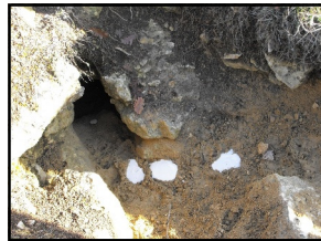
Les moulages des empreintes