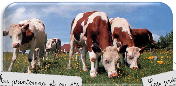
Au printemps et en été

Aux beaux jours, les vaches vivent dans les prés, partout en France jusqu'à 2000 m d'altitude. En hiver, les vaches rentrent à l'étable.