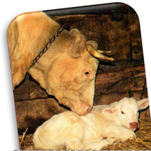
Le veau a 2 heures !

À la belle saison, la vache broute l'herbe fraîche des prés et boit jusqu'à 80 litres d'eau par jour à l'abreuvoir. En hiver, dans l'étable, elle mange du foin, de la paille, des céréales. Elle est herbivore.