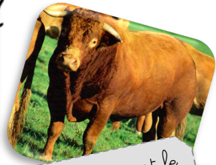
Le taureau est le mâle de la vache.