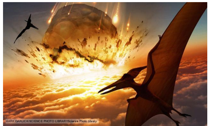
Un astéroïde entraîne la disparition des dinosaures